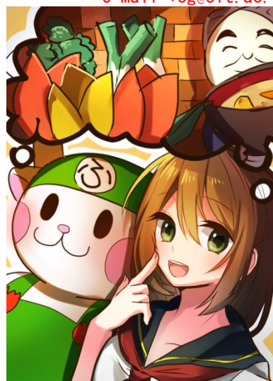
昨年度 深谷市郷土 PR 部門深谷市長賞作品

■主 催 SAIKO 埼玉工業大学 SAITAMA INSTITUTE OF TECHNOLOGY